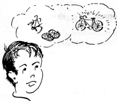
Budite jednako željni / da to završite kao što ste planirali