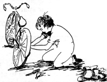
i završite posao!