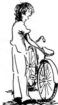
i uradite to sa / onim što sada imate.